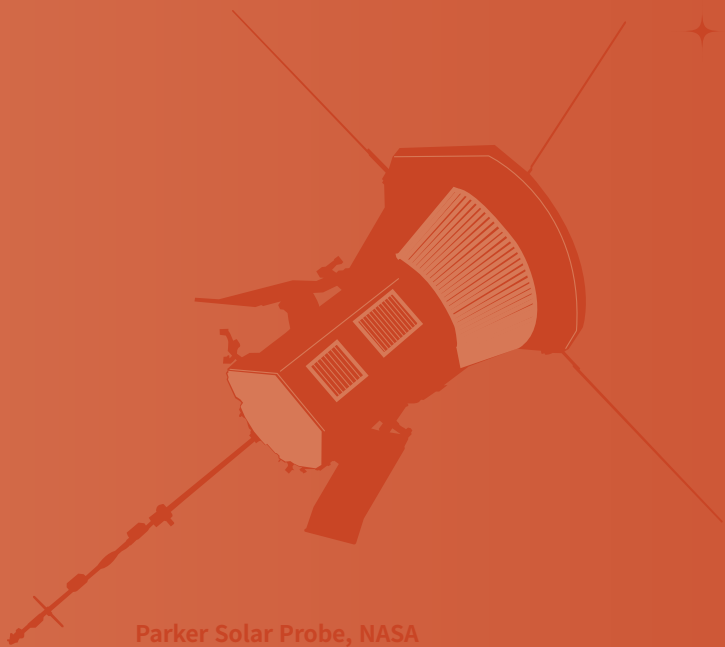
Parker Solar Probe, NASA